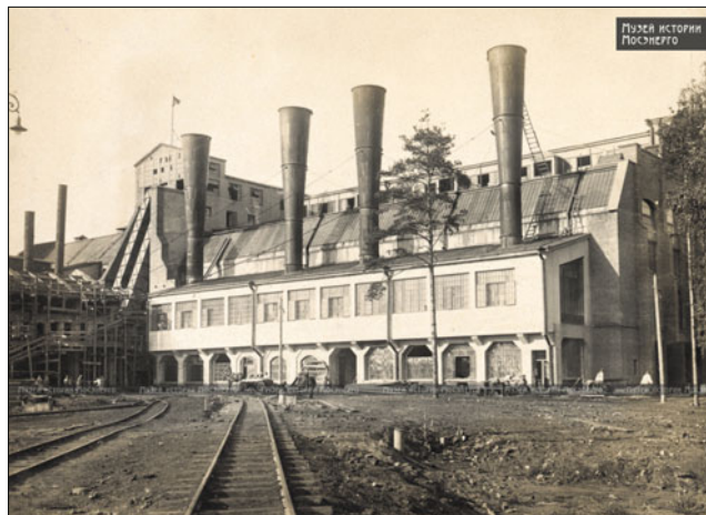
Районная электростанция “Электропередача”, работавшая на торфе. Электрогорск, 1920-е годы

пряжение связывающих их линий электропередачи всего 8 кВ, это был первый шаг в правильном, перспективном направлении – создании энергосистем.