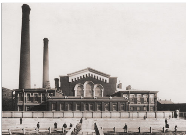
Центральная электрическая станция “Общества электрического освещения 1886 года”. Санкт-Петербург, конец XIX в.

Так, на Юге России 26 марта 1913 г. группа под руководством профессора-электротехника М. А. Шателена впервые в нашей стране осуществила параллельную работу тепловой (дизельной) и гидравлической электростанций – Пятигорской ТЭС и ГЭС “Белый уголь”. И хотя мощность электростанций была небольшой, всего по 400 кВт, а на-