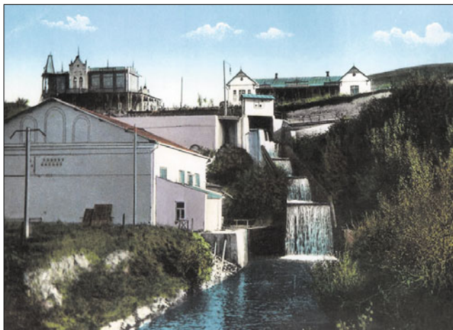
ГЭС “Белый уголь”. Ессентуки, начало XXв.