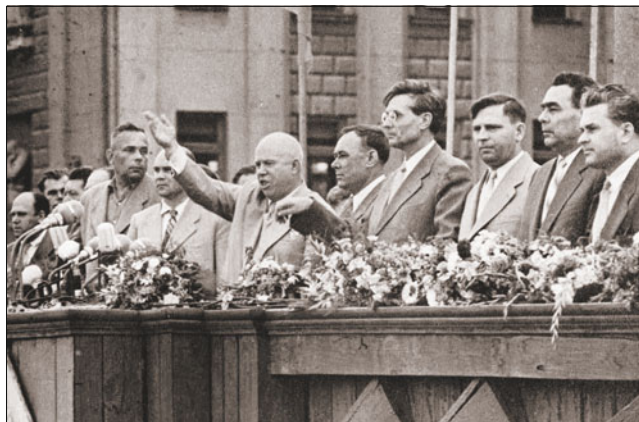
Правительственная трибуна во время торжественного митинга, посвящённого пуску Куйбышевской (Волжской) ГЭС им. В. И. Ленина. Выступает Н. С. Хрущёв, среди присутствующих Л. И. Брежнев, М. А. Суслов и др., Жигулёвск, 1957

Реорганизованное ОДУ Центра приступило к подготовке к вводу в эксплуатацию первой цепи ЛЭП Куйбышев – Москва. Линия 400 кВ протяжённостью почти 1000 км была уникальной не только для нашей страны – у неё не было аналогов и в зарубежных энергосистемах. Всё приходилось делать впервые. Для улучшения использования пропускной способности и повышения надёжности работы ЛЭП 400 кВ разрабатывались усовершенствованные устройства релейной защиты и противоаварийной автоматики. Диспетчерская служба знакомилась с новым оборудованием непосредственно на строящихся энергообъектах и активно готовила инструкции по оперативному управлению электропередачей. Служба релейной защиты во взаимодействии с разработчиками новых устройств РЗА выпускала инструкции по эксплуатационному обслуживанию этих устройств. Служба режимов была ответственной за инструкции по режимам работы электропередачи и инструкции по предотвращению и ликвидации аварийных нарушений. Связисты устанавливали прямые каналы диспетчерской связи со всеми энергообъектами электропередачи Куйбышев – Москва.