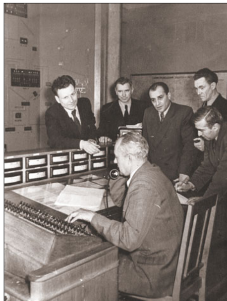
Включение ЛЭП Куйбышев – Москва, 30 апреля 1956 г.