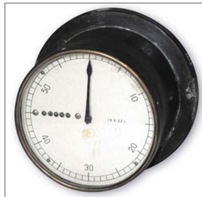
Щитовой ваттметр, Мосэнерго, 1950-е годы

Формированию и развитию ОЭС способствовало и то, что руководящий персонал энергосистем проявлял большую заинтересованность в быстрейшем их включении в состав ОЭС, так как при параллельной работе улучшалось качество электроэнергии по частоте, задача поддержания заданных перетоков мощности становилась более простой, благодаря взаимопомощи энергосистем в нормальных режимах облегчалось проведение ре-